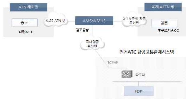
[그림 2-1] 항공고정통신망 구성(예시)